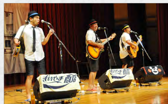
おでかけがんじゅうタイム 2015