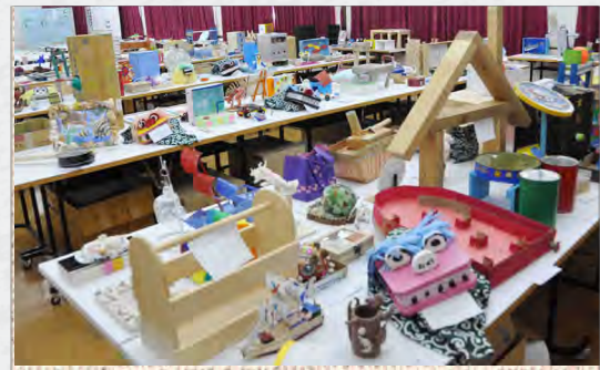
第 10 回宮古島市民総合文化祭