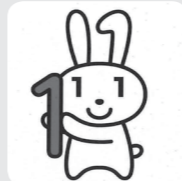
マイナンバーイメージキャラクター マイナちゃん

宮古島市内では、11月13日より世帯主宛に通知カードを簡易書留でお届けしましたが、お受け取りできましたか？郵便局で保管期限を過ぎた通知カードは、来年の3月末（平成27年度内）まで市役所で保管されています。市役所での保管期限後は再発行扱いになるので、まだ受け取られていない方は、お早めに市民生活課までお問い合わせください。