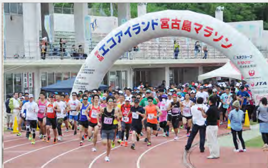
第 6 回エコアイランド宮古島マラソン