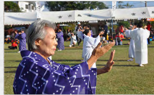
第 1 4 回クイチャーフェスティバル