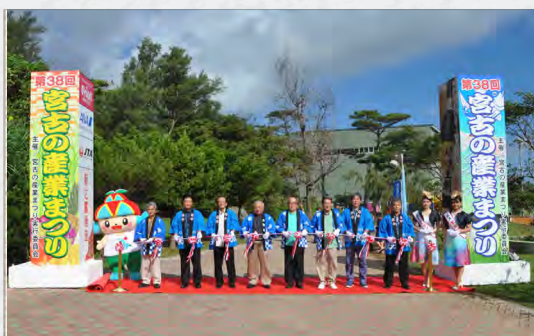
第 3 8 回宮古の産業まつり